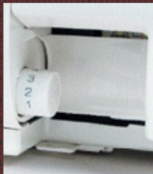
leicht zugänglicher Einstellknopf