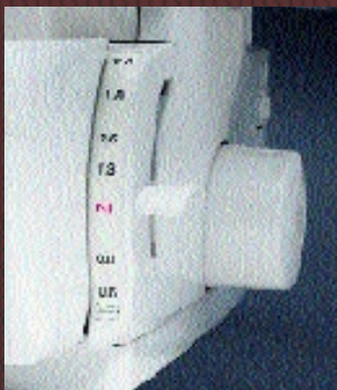
Differentialtransport für optimale Nähergebnisse