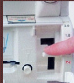
Exklusiv Jet-Air- Greifereinfädelsystem. Einfach genial.