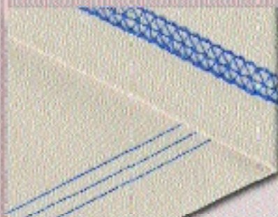
3-fach Coverstich 6 mm

zum Säumen von sehr elastischen Materialien, für Ziereffekte