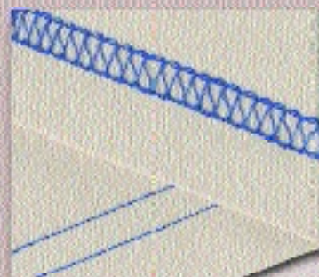
2-fach Coverstich 6 mm

zum Säumen von sehr elastischen Materialien, für Ziereffekte