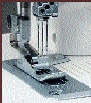
Exklusiv absenkbarer Transport