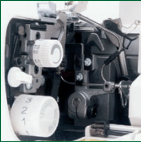
übersichtliche Anordnung der Einstellknöpfe