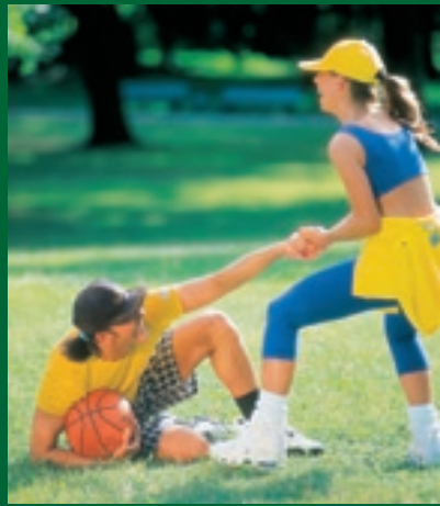
... mehr als nur verbinden.