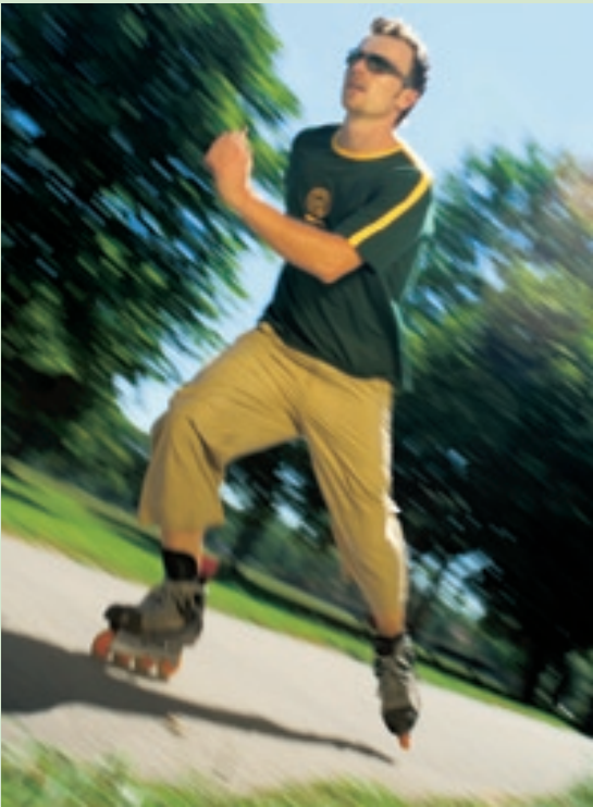
... bringt Bewegung.

Selbstverständlich ist die Maschine mit hochwertiger Technik, wie dem ATD-System, dem unentbehrlichen Jet-Air-Einfädelsystem und vielen weiteren technischen Raffinessen ausgestattet.