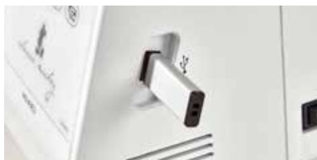
USB-Anschluss zum Importieren von Motiven