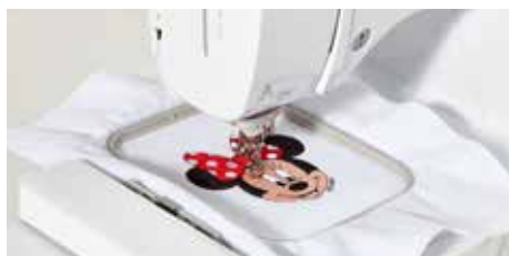
Stickfläche von 100 x 100 mm